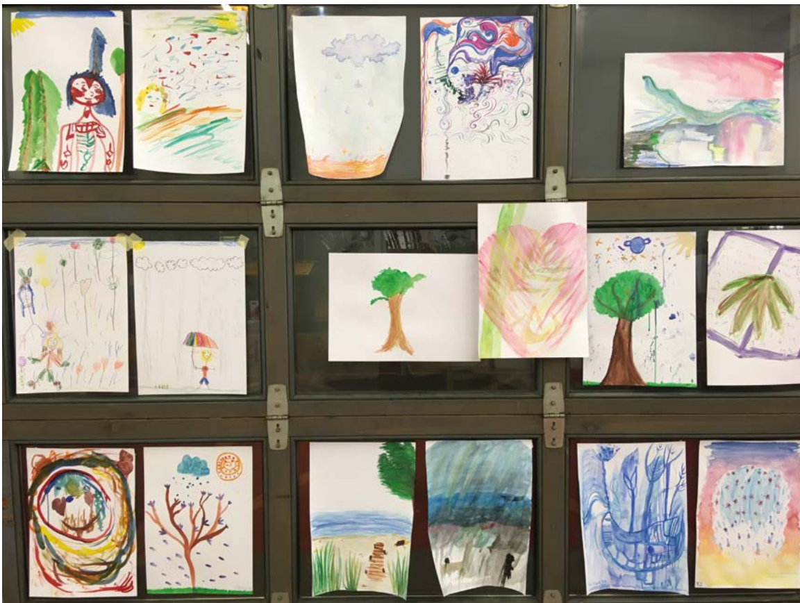
Museumsnacht 2022, Malen nach Wort und Klang, Foto: Ruth Skibow- ski

Zum ersten Mal seit zwei Jahren konnte die Kieler Museumsnacht wieder Ende August im gewohnten Rahmen durchgeführt werden. Die vhs-Kunstschule bot unter dem Titel „Malen nach Wort und Klang“ eine offene Kunstaktion im Foyer der Stadtgalerie Kiel an. Angeregt von literarischen Texten oder Musik malten rund 80 Besucher*innen eigene Bilder.