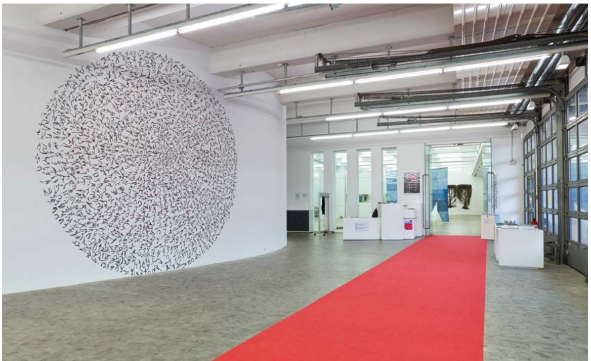
Gottfried Brockmann Preis 2021 Ausstellungsansicht