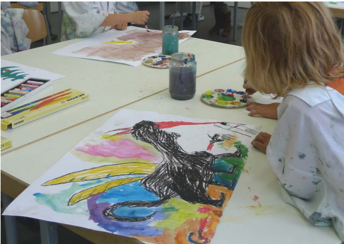
KitaKulturTage